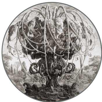
Le grand vase, lavis d'encre de Chine, 1994, ø 80 cm