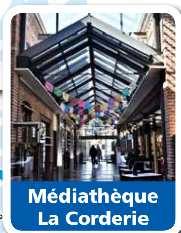
Médiathèque La Corderie