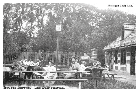
Direction des Affaires Culturelles Service Patrimoine - 03 20 81 91 46 56, rue Albert Bailly - Ville de Marcq-en-Barœul

On pouvait y manger et boire (moins cher qu'à Lille). Bien souvent la guinguette comprenait aussi un jeu de boules en salle et un vaste espace extérieur tel un pré ou un verger.